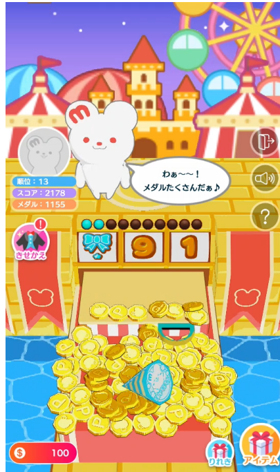
<「ミックマのメダルパーク」プレイ画面イメージ>

このたび第3弾ゲームとしてリリースした「ミックマのメダルパーク」は、画面に表示されるパークメダルやきせかえボールを、メダルプッシャーでゲットエリアに落として遊ぶオリジナルゲームです。ライバーがライブ配信中に本ゲームを起動すると、遊園地をモチーフとしたプレイ画面上に「ミクチャ」のオリジナルキャラクターのミックマが3Dで登場し、ゲームに合わせて様々な表情やアクションを見せます。