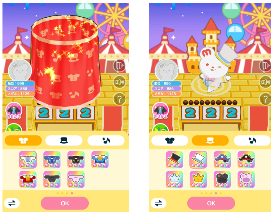
<ミックマきせかえ画面イメージ>

パークメダルを落とすとその枚数に応じてスコアが加算され、登場したきせかえボールを1分以内に落とすとスコアが加算されると共にミックマのきせかえアイテムをランダムで獲得できます。