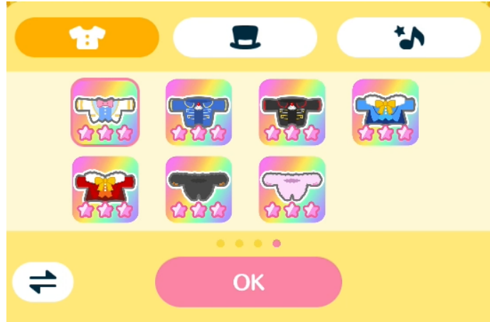
<きせかえアイテムイメージ>

リスナーは、ライバーのプレイ画面を見て楽しむことはもちろん、応援アイテムを送信してライバーのプレイをサポートすることが可能です。応援アイテムには通常のライブ配信時に送信するアイテムと同じモチーフや、プレイ画面上のパークメダルやきせかえボールを全て落とすことができる強力なアイテムもご用意しています。また、応援アイテムを送信するとライバーのスコアにも加算されます。