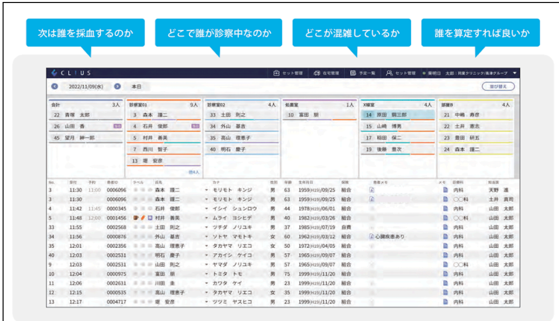
「みえるか診療一覧」画面イメージ

患者様の診療導線やステータスを1画面で確認することが出来るので、混雑時には診療の順番を変更するなど、患者様の待ち時間を短縮することができます。