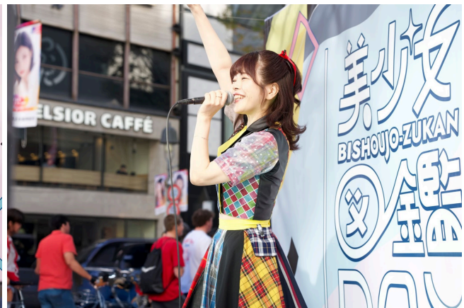
あっす〜【おこさまぷれ〜と】